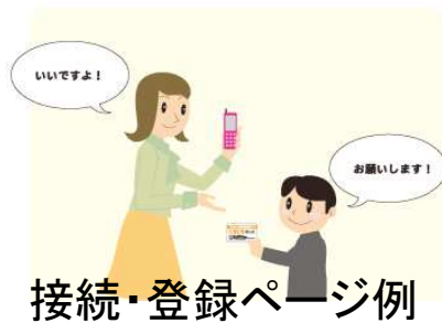
接続・登録ページ例